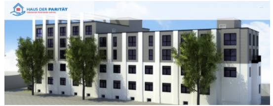
Abbildung 1 - Haus der Parität