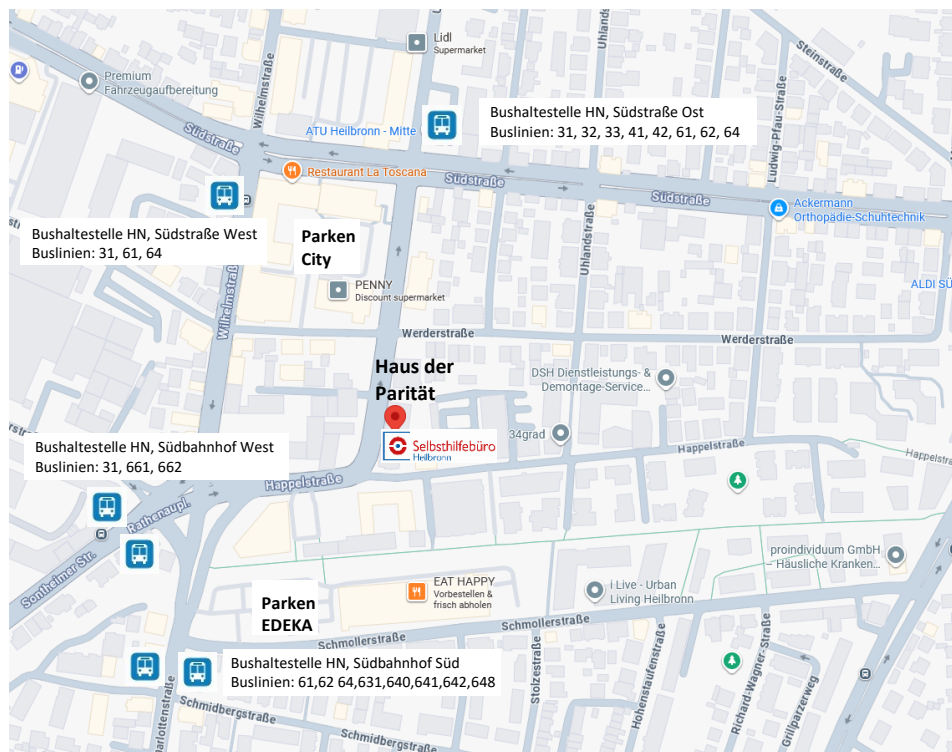
Abbildung 4 - Plan Anreise und Parken

EDEKA-Parkplatz, Charlottenstraße 9 (max. 90 Min. – elektronisches Erfassungssystem!)